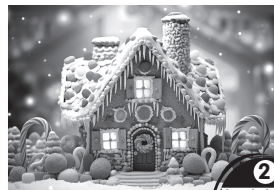
Duftkarte mit Rezept