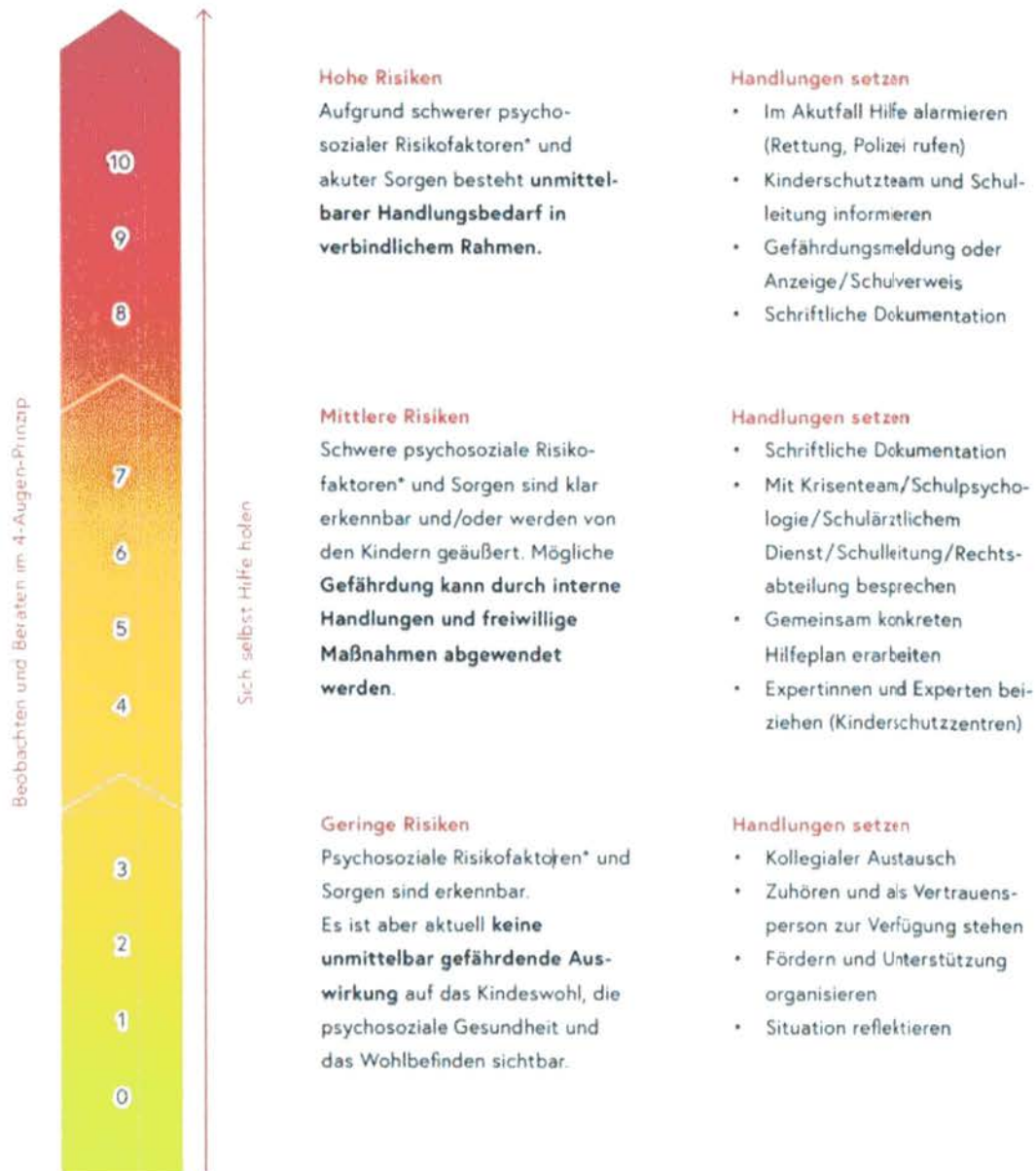
Abbildung: Sorgenbarometer

Psychosoziale Risikofaktoren siehe Leitfaden Kinderschutz und Schule, Punkt 3. Symptome & Folgen von Gewalt: Sichtbare (körperliche) Hinweise, Anzeichen im Leistungsbereich, emotionale und soziale Verhaltensauffälligkeiten.