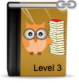
Gibt es bei uns Schakale? (Bernhard Strobel)