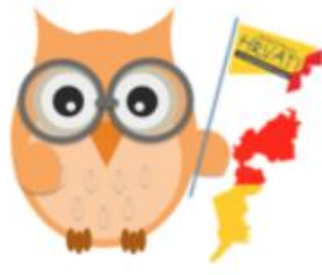
Bgld Kroatische Leseübungen