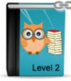
Die Rettung der Burg Güssing