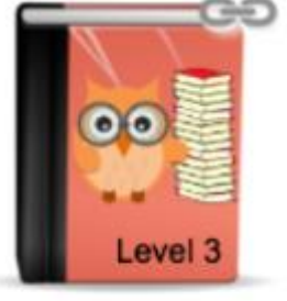
Roma und Sinti